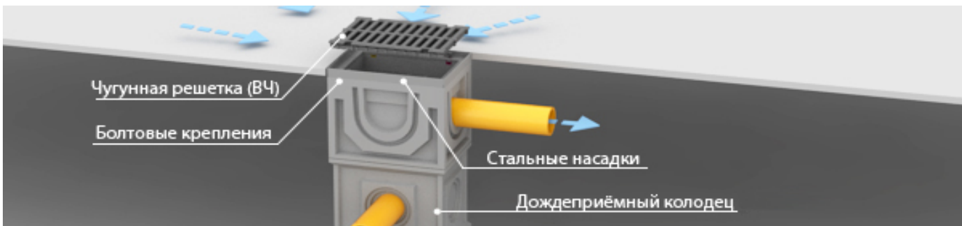
точная система поверхностного водоотвода универсального применения, нагрузка Б-125