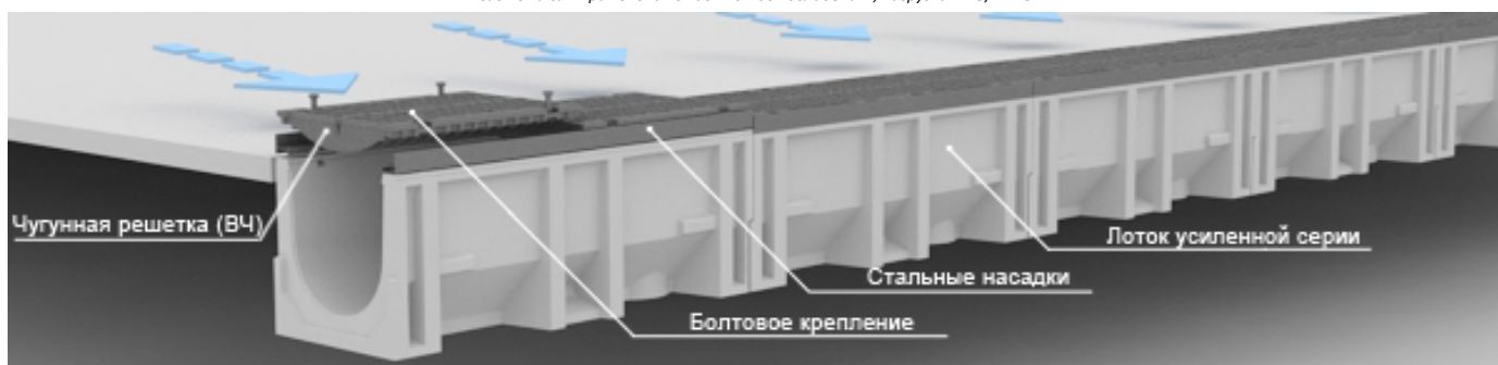
система для применения в промышленном и гражданском строительстве, нагрузка А-15/Б-125